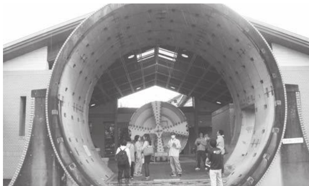
下水処理施設を見学

卒業に向けたグループ学習として、「リサイクルについて」と「野崎観音もう一つの参道」の2グループに分かれてグループ学習に取り組みました。