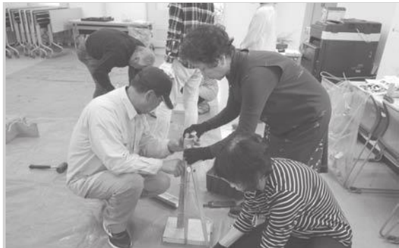
竹細工作りを実践