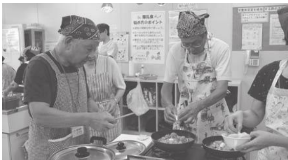
減塩メニューの調理実習

健康学部は、「正しいウォーキング」「ストレスの正体」「年代別の食の課題を知ろう」「体験学習(ウォーキング)」「調理実習(減塩メニュー)」など、栄養・運動・休養の3本柱を基本に、健康を切り口とした学習を提供します。講座や実習を通じて、健康についての基礎的な知識を身に付け、心豊かで充実した生活基盤を確立するとともに、家庭・地域・全市民へと健康づくりの輪を広める役割を担う人材を育成することを目的にしています。