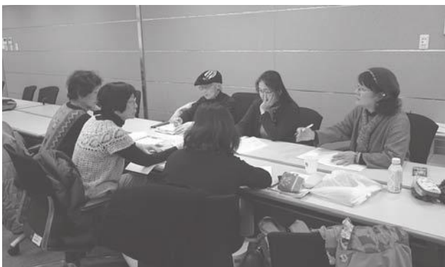
グループ学習の様子