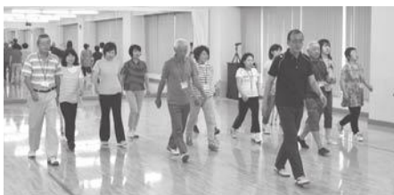
正しいウォーキングを学びます

受講者は、健康についての知識が広がっただけではなく、学んだことを実践し継続している人たちや、学んだ知識を家族や友人に普及啓発する人たちもたくさんいます。このように「健康」を切り口に自分自身について学び考える機会を通して、家族や友人・知人への健康意識の向上、市民全体の健康寿命の延伸などをめざし、健康づくり・仲間づくり・生きがいづくりが学べるプログラムとなっています。