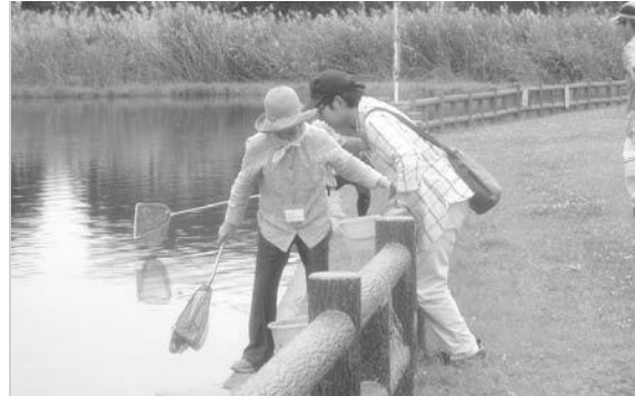
深北緑地で淡水魚の調査