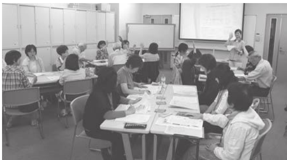
年代別の食の課題を知ろう