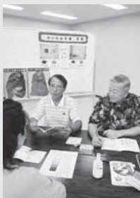
(保健医療福祉センターで撮影)

禁煙は 難しくありません まずはStep1 禁煙方法を 知ることから 始めましょう