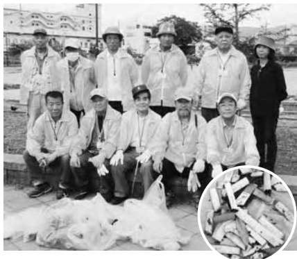
5月31日の世界禁煙デーにたばこポイ捨て防止のための清掃活動を実施しました

●ところ 保健医療福祉センター ●活動内容 禁煙状況の報告、たばこポイ捨て防止のための清掃活動、肥満防止のためのウォーキングなど