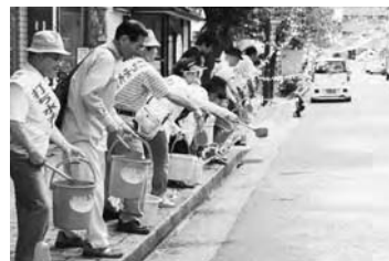
昨年の「打ち水大作戦」