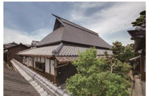
5 国登録有形文化財 辻本家住宅

辻本家は、江戸時代に御領村の庄屋を代々つとめた旧家です。屋敷地の中央にある木造平屋建て、銅板葺(元は茅葺)の主屋は、江戸時代後期の天保5年(1834)に建てられたもので、平成27年8月に大東市で初めて国登録有形文化財に登録されました。