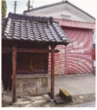
6 大東市指定文化財 永祿稲地蔵

西福寺西側。半肉彫の地蔵で、銘が刻まれており、それによると頼尊越後助が永祿元年(1558)8月、逆修のために大乗妙典千部を供養したとある。ちょうど戦国時代である。明日をも知れぬ生命のため。彼は生前に自分の死後の供養をしたと思われる。