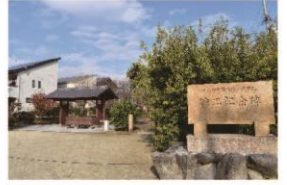
1 大東市御領土地区画整理 竣工記念碑