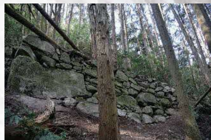
5. 曲輪群E 南側尾根の石垣