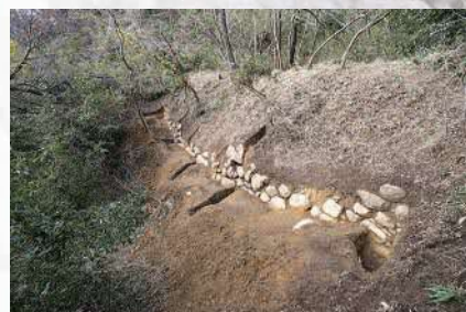
7. VIII郭(千畳敷郭)の石垣