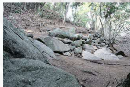
6. V郭(御体塚郭) 南側の石垣