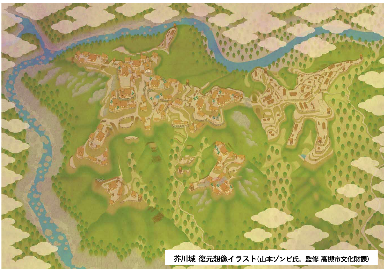
芥川城 復元想像イラスト(山本ゾンビ氏。監修 高槻市文化財課)

→しかし、山に築かれた芥川城が天下の政庁であったことは明白です。また、『瓦林政頼記』の記述が永正13年以前を指すことも判明しました。遺跡と歴史を正しく認識するためには、昭和になって付けられた名称ではなく、戦国の人々が使用した名称を使う必要があります。