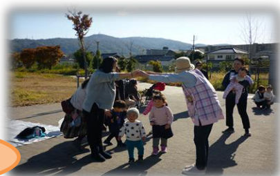
昨年度の公園で遊ぼう!の様子