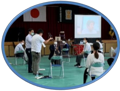
↑臨時休業中、広い体育館でリモート型の教職員研修を実施。

仕切りなどでコロナ対策を工夫・徹底しながらの保育活動。夏まつりへ向けて、ちょうちんかざりを制作。↓