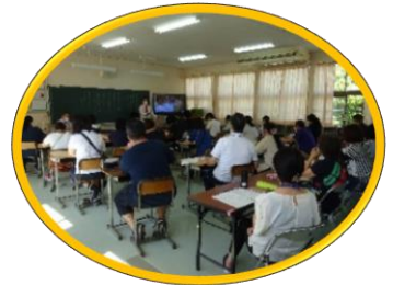
↑ビデオで事前に録画した授業を見ながら、授業づくりについての教職員研修を実施。

マスク、フェイスシールド、ソーシャルディスタンスなど、万全にコロナ対策をしながら、「学び合う」授業を実践。↓