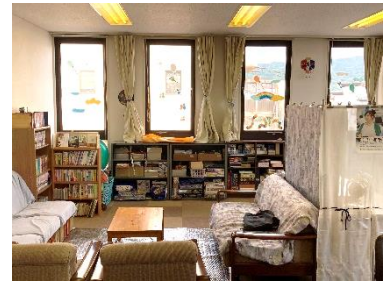
大東市教育支援センター「ボイス」