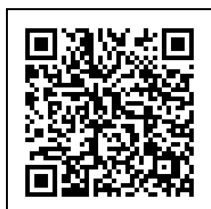
メール相談専用QRコード

また、「親の思いがうまく伝わらない」「子どもがいじめられているかも？」といった保護者の悩みに対応するため、「教育相談室」を開設しています。場所は、「ふれあい教室ボイス」と同じキッズプラザの2階です。教職経験豊かなスタッフが、さまざまな悩みに寄り添います。開室日は下表②の通りですが、メールでの相談は、開室時間外でも随時、受け付けています。