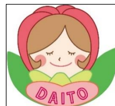
家庭教育支援チームつぼみ