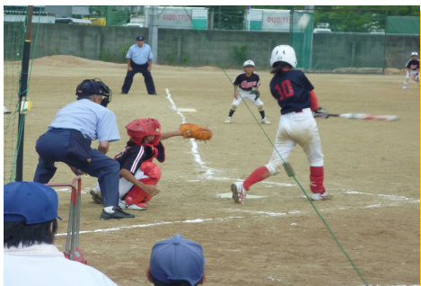
〈ソフトボール大会の様子〉

こども会はスポーツ事業だけでなく、かべ新聞づくりや作文コンクールなど文化事業も実施しており、いろんな子どもたちが自分の得意なジャンルで活躍することができます。みなさんもこども会活動に参加し、地域を盛り上げていきませんか？教育委員会でも、充実したこども会活動が行っていきけるよう、支援を続けてまいります。