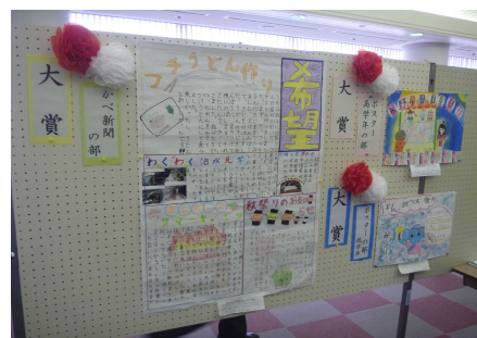
〈フェスティバルの入賞作品〉