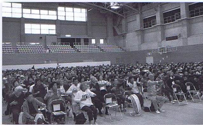
「大東元気でまっせ体操」を実施しているみなさんが集まった交流会

た影響もあり、再び認定率については上昇してきているものの、全国や大阪府の認定率に比べると低く、十分にその効果は実証されているといえる。また、実施グループ数や参加者の数についても平成17年度の開始直後は19グループ、実登録者数389人であったが、平成26年2月末現在においては93グループ、1868人にまで増加して