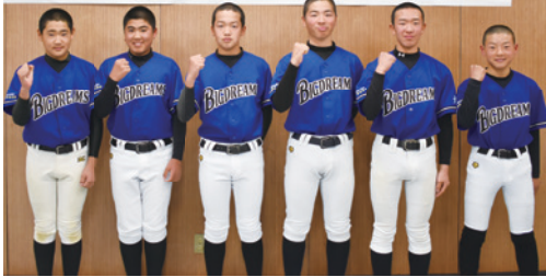
門真ビックドリームス 「文部科学大臣杯 第10回記念 全日本少年春季軟式野球大会」出場