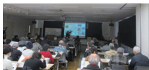
シンポジウムの様子

平野屋新田会所跡をはじめとする、深野池の新田開発にまつわる歴史遺産を市の財産として残し、まちづくりにも活用するため、調査や魅力発信などを行います。