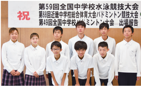
祝 第59回全国中学校水泳競技大会 第68回近畿中学校総合体育大会バドミントン競技大会 第49回全国中学校バドミントン大会 出場報告

「第59回全国中学校水泳競技大会・第71回近畿中学校選手権水泳競技大会・第42回全国JOCジュニアオリンピックカップ夏季水泳競技大会」出場