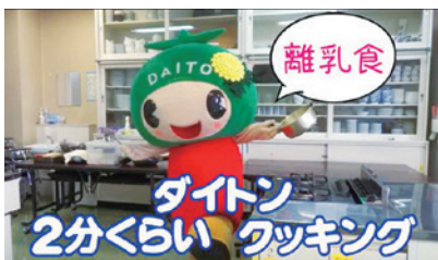
毎週続々と更新予定!

大東市離乳食講習会で紹介している離乳食の作り方や、離乳食メニューをホームページと、市公式YouTubeから見る事ができます。ぜひご活用ください。 ●メニューに「にんじんとりんごのおろし煮、パンがゆ、野菜スープ、昆布だしほか」 ☎ 大東市 2767