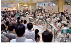
大東四條畷消防市民音楽隊 Wings

防災に関する講演会と地震を想定した避難訓練コンサート②防災ミニ展示会。段ボール防災用品の組み立て体験やオリジナル避難すごろくあり ④講演：きょうからできる災害情報の「みかた」・福本晋悟さん、演奏：大東四條畷消防市民音楽隊Wings 定先着200人 ⑤整理券要 ⑥サティホール事務所で整理券配布 ⑦コンサート参加者には防災食プレゼント ⑧サティホール ☎873・0030