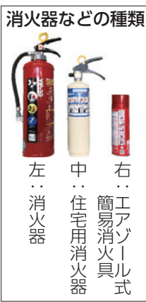
左: 消火器 中: 住宅用消火器 右: エアゾール式簡易消火具

なお、消防職員が消火器などを販売することはありません。不適切な訪問販売や点検トラブルにご注意ください。