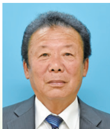
中河 昭(76) 自民 現 8