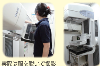
実際は服を脱いで撮影

マンモグラフィは乳腺・乳がん専用のレントゲン撮影です。乳房を片方ずつ挟んで撮影し、しこりの有無や大きさなどを調べます。 ※乳がんエコーは実施していません