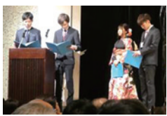
昨年度の運営委員

時 来年1月11日(祝) 対式典の実施の有無は未定 対平成12年4月2日〜平成13年4月1日生まれの市民 甲 岡 6月15日までに生涯学習課 ☎870・9686 FAX 870・9687