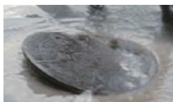
浮き上がってずれたマンホールのふた

市では下水道管に流入した雨で、マンホールのふたが外れない仕組みになっている、浮上防止ロック機能が付いたマンホールへの取り替えを平成17年から順次行っています。