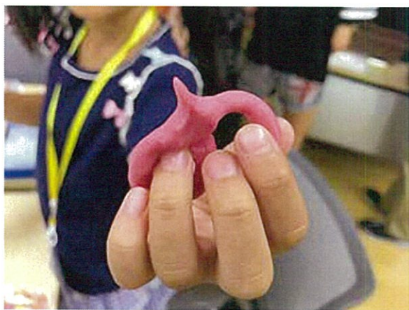
プロトタイプ作成