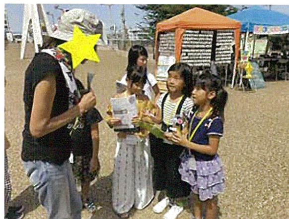
ビジネスについて、街頭リサーチ