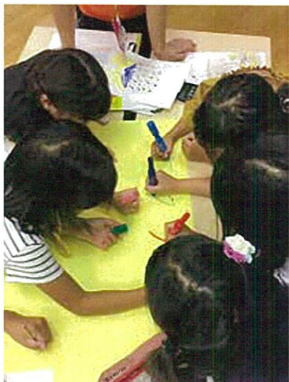
アイデア出しの様子