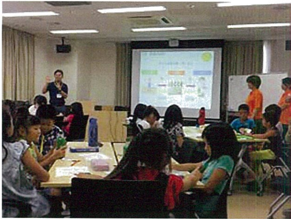
関西キャリア教育コーディネーター協会による ビジネスの授業