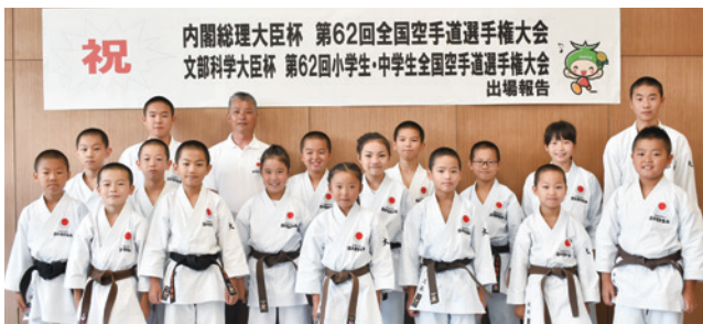
(公社)日本空手協会 大東支部 「内閣総理大臣杯 第62回全国空手道選手権大会」出場 「文部科学大臣杯 第62回小学生・中学生全国空手道選手権大会」出場