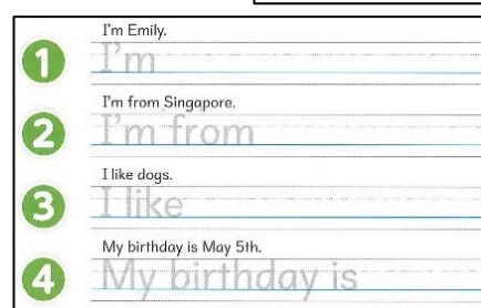
小学校使用教科書 「NEW HORIZON Elementary」東京書籍