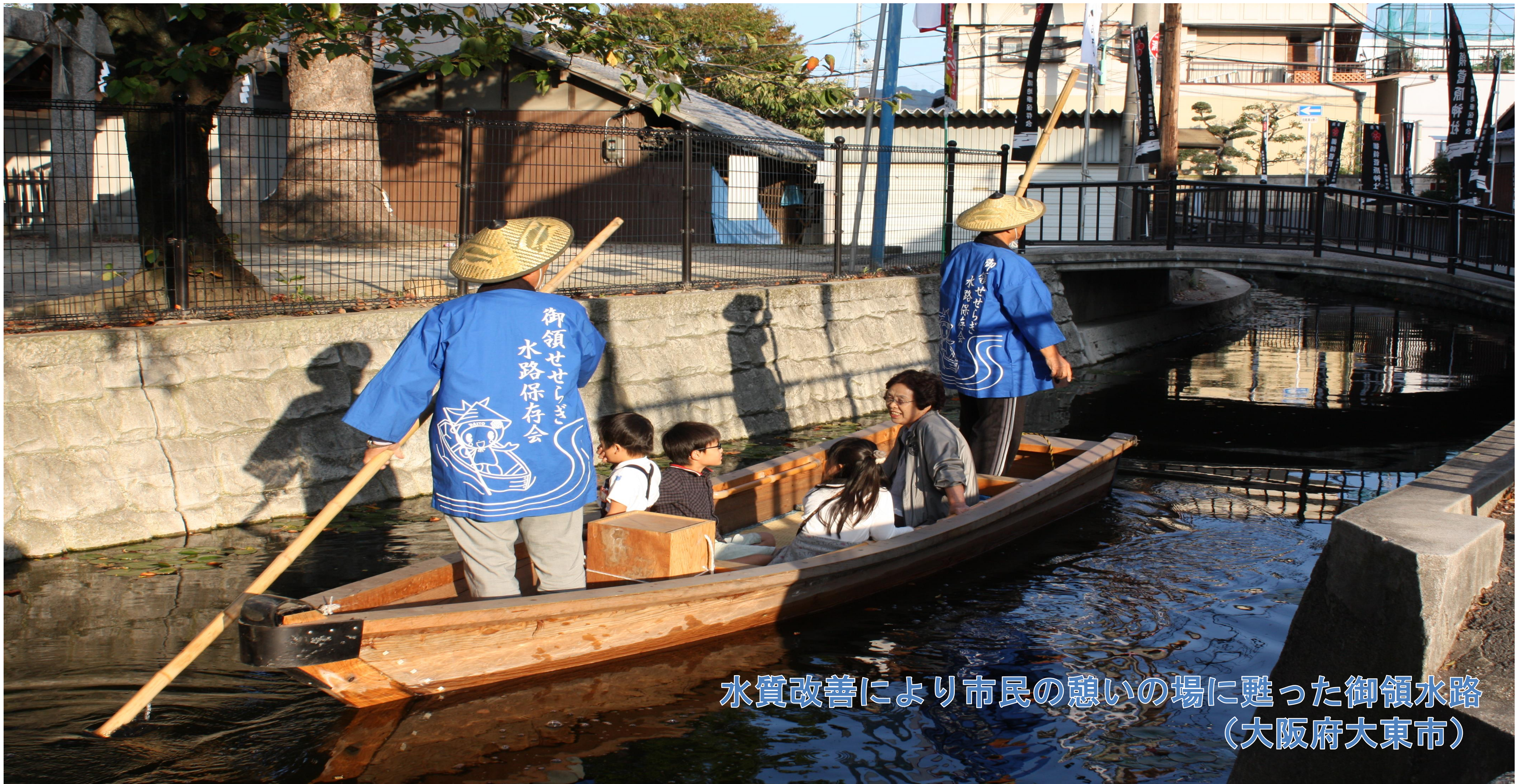
水質改善により市民の憩いの場に甦った御領水路 (大阪府大東市)