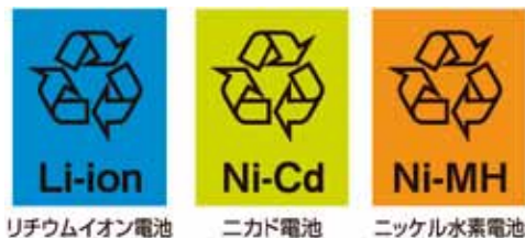
リチウムイオン電池 ニカド電池 ニッケル水素電池