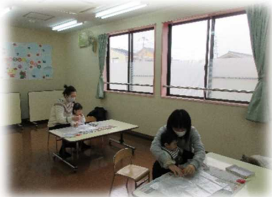
ポリ袋に絵を描いて、凧を作りました。お部屋で飛ばしたよ。

さあ、4月、さわやかな春風が吹く季節を迎えました。今年度も、子育て中のみなさんが笑顔で安心してつながり、楽しく子育てが出来る場になるようにと思っています。戸外でいっぱい遊べる講座や、親子で楽しめるものも企画しています。遊びに来てくださいね。(新型コロナウイルス感染症拡大防止の為、講座・通常利用・育児相談は引き続き電話での予約制です)