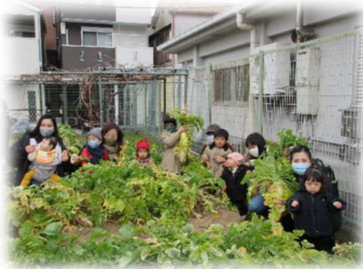
野崎リフレッシュクラブの皆さんが育てた大根を引かせてもらいました。