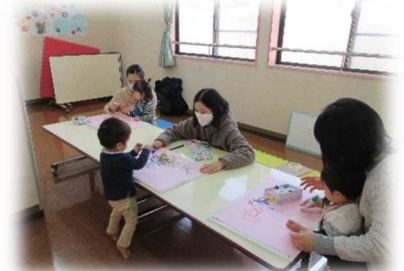
お絵描き、楽しかったね。