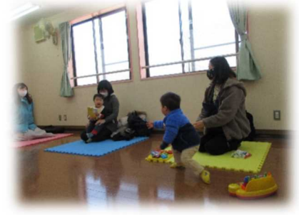
保健師さんに育児相談しました。