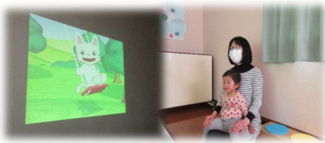
ノンタン大好き！シリーズ楽しかったよ。

(新型コロナウイルス感染症拡大防止の為、講座・通常利用は引き続き電話での予約制です。尚、電話での育児相談も承っています)