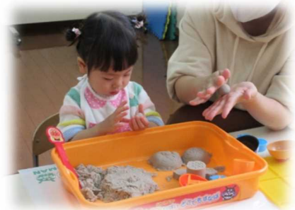
ママと一緒にごちそう作ろう～