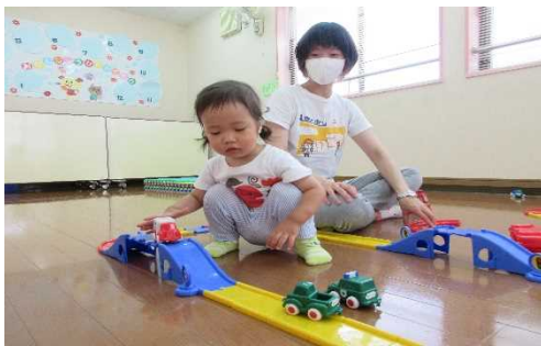
見て見て レールをいっぱいつなげたよ。 電車で遊ぼう

蝉の聲がにぎやかに聞こえ夏真っ盛り。子どもたちは暑くても元気いっぱいです。外に出るときは帽子を忘れずにかぶりましょうね。そして、適度な水分補給と休息を心がけましょう。さて、センターではしゃぼん玉、金魚すくいごっこ、水遊びを毎週企画しています。遊びに来てください。(新型コロナウイルス感染症拡大防止の為、講座・通常利用は引き続き電話での予約制です。尚、電話での育児相談も承っています)