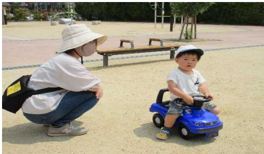
お気に入り青い車。 センターにて貸し出します。