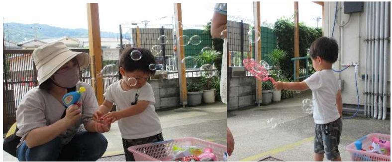
ピストル型のおもちゃでするしゃぼん玉。消防車、新幹線、ペンギンもあるよ。次はどれにしようかな～あわあわ、いっぱい出たよ!