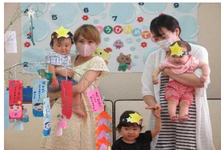
七夕まつり・これからも 元気にすくすく育てね