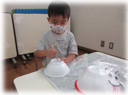
発泡スチロールに穴開けて・・・

季節の変わり目は、気温の変化もあり体調管理が大切です。食欲の秋はおいしいものがいっぱい。りんご、さつまいも、さんまなど旬の食べ物を食べましょう。外で体を動かすのが気持ちいい季節です。元気いっぱい遊びましょう。センターでは外遊びおもちゃなど貸し出しますので利用してくださいね。(新型コロナウイルス感染症拡大防止の為、講座・通常利用は引き続き電話での予約制です。尚、電話での育児相談も承っています)