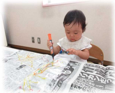
マジックでおぼけも描いちゃおう 水鉄砲、飛ばしあい楽しかったよ。来年は思う存分水遊びができますように！