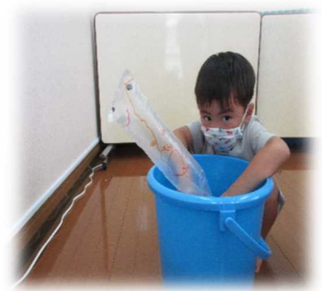
バケツの水で実験だ！