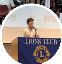
▲英語で熱く語りました