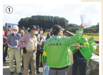
① ▲これから田原城跡に 登ります

出城とは、本城の外の要地に築いた小規模の城のことで、田原城・龍間城・野崎城・三箇城は、一説では飯盛城の出城であったと考えられています。この4つの出城に焦点を当て、防衛拠点としての役割を学ぶだけでなく、現地を訪れることで曲輪などの遺構からその規模や性質を推測し、戦国ロマンをリアルに感じることができました。道中は、心地よい程度のハイキング。「今度は孫も連れてきたい」と話す参加者は、充実した笑顔を見せてくれました。