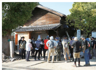
② ▲三箇菅原神社の隣に 立つ三箇城跡の石碑