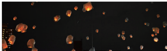
▲「塔の上のラプンツェル」のテーマ曲に合わせて…