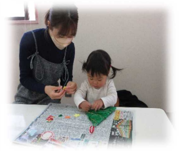
ペタペタ貼ってツリー作ろう