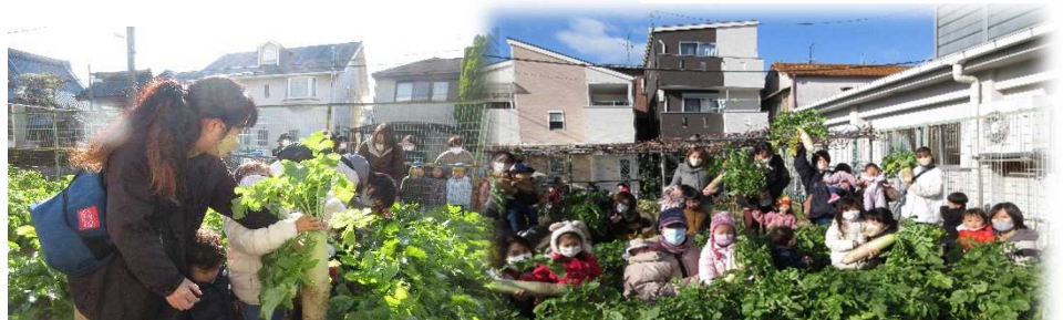
かいっぱい引っ張って！今年も立派な大根が収穫できてみんな大喜びです お世話くださった職員の皆様ありがとうございました