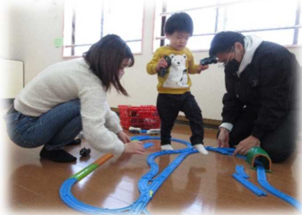
パパも一緒、フラレールで遊ぼう

節分が過ぎると春に一步ずつ近づきますよ。そう言ってもこれからが寒さの増す時期ですね。「ひよっこ」はお友だちが遊びに来てくれるのを待っています。子育て支援センターでほっと一息ついてくださいね。空気が乾燥しています。まだまだ感染症の流行にも引き続き注意をしていきましょう。 (新型コロナウイルス感染症拡大防止の為、講座・通常利用は引き続き電話での予約制です。尚、電話での育児相談も承っています)