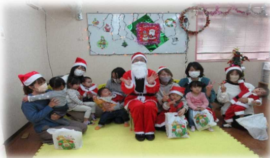
やったー！サンタさんが来てくれました