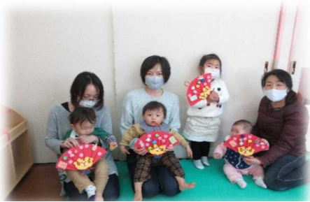
寅年は扇の飾りで、おめでとう 元気ですくすく育ちますように