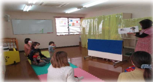
大きなかぶごっこ 絵本のお話を聞いた後、かぶを引っ張りました 楽しい様子は、広報「だいとう」で紹介されましたよ