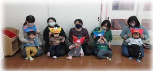
お面作って、鬼に変身!?悪いものは追い払って、みんな元気に大きくなあれ

気持ちの良いポカポカ陽気と共に、それぞれに新しい生活がスタートする春がやってきました。今年度も四条子育て支援センターでは、遊びに来てくださる親子の皆さんがゆったりと過ごしてもらったり、戸外で体を使って活動できる取り組みも計画しています。ぜひ遊びに来てくださいね。 (新型コロナウイルス感染症拡大防止の為、講座・通常利用は引き続き電話での予約制です。尚、電話での育児相談も承っています)