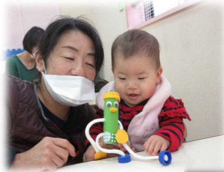
ぶらぶら人形作ったよ!ひもを引っ張ると手足が伸びたり縮んだり、おもしろいね