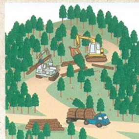
適切に森林整備を推進!

ことから、森林の土地の所有者の把握を進めるため、平成24年4月から森林法に基づく森林の土地の所有者となった旨の届出制度が創設されました。なお、この届出により、森林の土地の所有権の帰属が確定されるものではありません。