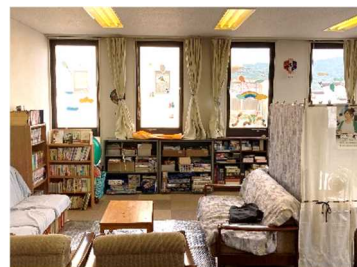
大東市教育支援センター「ボイス」