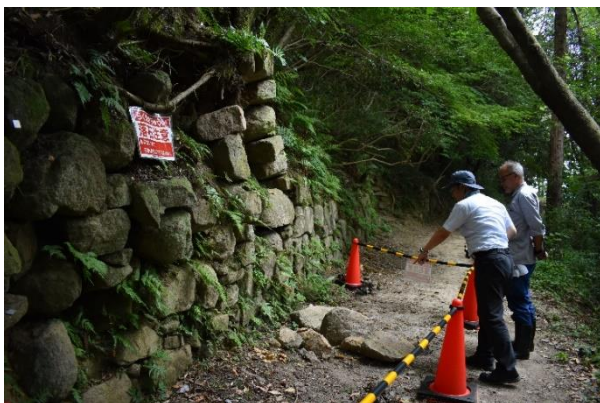
平成30年7月豪雨の際に石材の一部が崩落した石垣

活用面では城跡までの誘導サインや遺構の解説板の不足、石垣を見学するにあたり来場者の安全確保、山頂からの眺望を阻害する樹木の管理等、今後、史跡を保存・活用するために解決すべき問題点や課題が多くある。