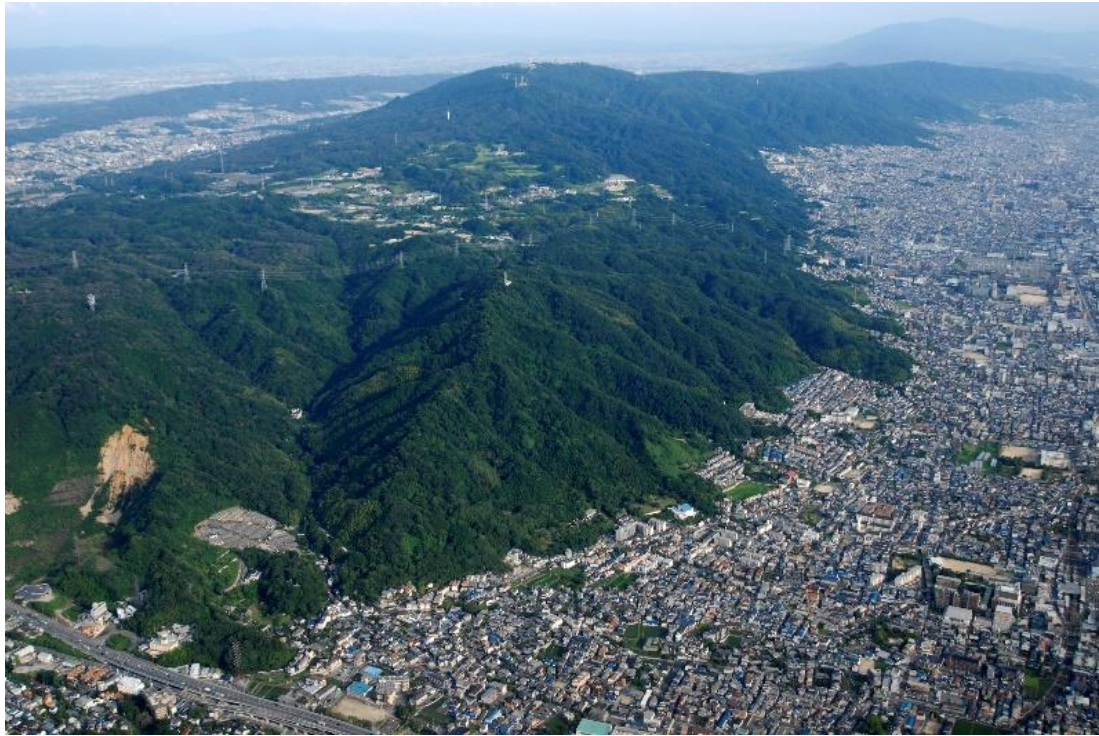
飯盛城跡 遠景 北西から