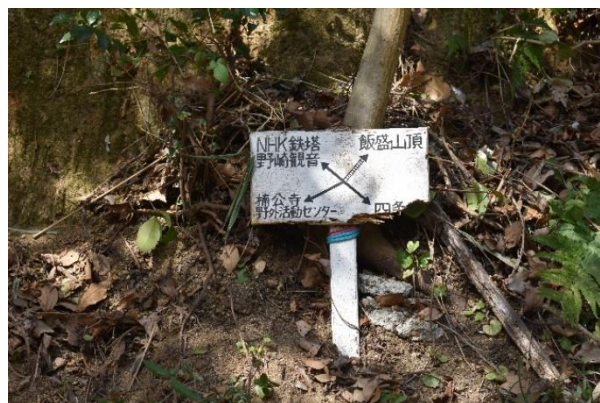
手作りの誘導看板(設置者不明)