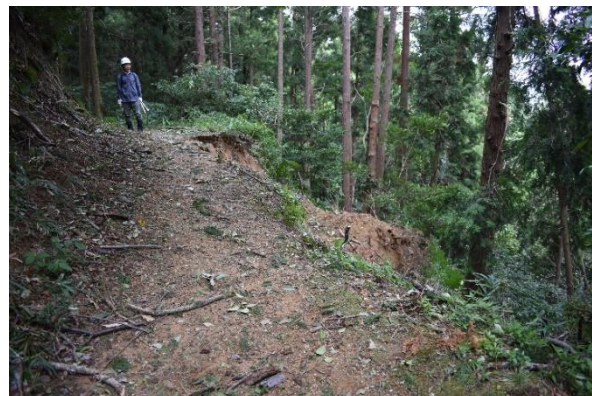
平成30年の台風21号 曲輪法面の崩壊