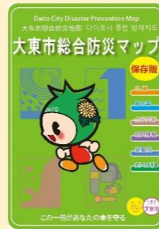
大東市総合防災マップ→