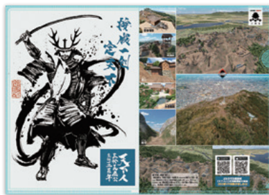
国史跡飯盛城跡 オリジナルクリアファイル