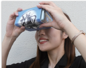
よみがえる飯盛城アプリ用 組立式VRゴーグル