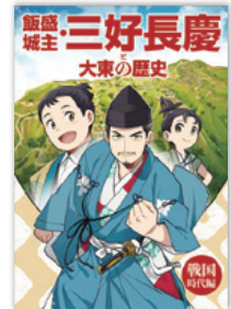
マンガ 「飯盛城主・三好長慶と 大東の歴史 戦国時代編」