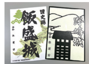
御城印(飯盛城・野崎城)