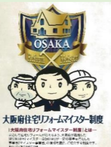
大阪府住宅リフォームマイスター制度→