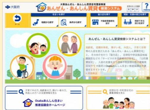
大阪府のあんぜん・あんしん賃貸検索システム→