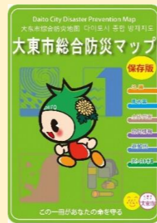
大東市総合防災マップ→