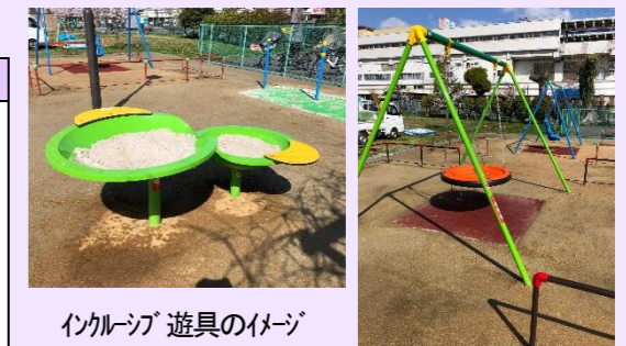
インクルーシブ遊具のイメージ