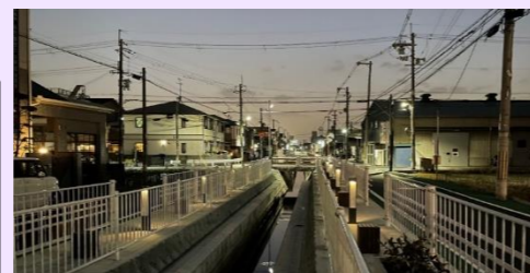
親水機能を持った水路整備（新田水路）↑