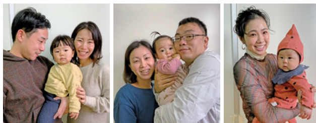
ネウポランドだいとう利用者の皆さん

「子どもと過ごす時間は人生の6パーセントにすぎない」という記事を読んだことがあります。にわかには信じがたい数字ですが、もし本当ならば、笑顔いっぱいの「6パーセント」にしたいものです。子育てに不安や悩みを抱えている人はぜひ、ネウポランドだいとうへご相談ください。(1~4ページに関連記事あり) (中)