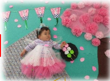
「桜まつり」の寝相アート