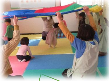
英語で遊ぼう。「キッズイングリッシュ」