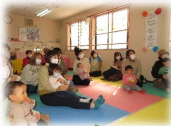
お話の会「パーパパパ」