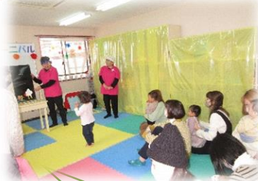
お話の会「はなみずき」

21周年を迎えた「ひよっこ」。日ごろ応援して下さいているボランティアの皆さんが楽しい時間をプレゼントしてくださいました。