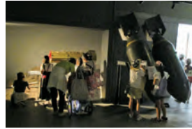
過去の平和バスツアー

時8月22日(火)正午〜午後4時30分 所 集合 市市民会館 行 先 市内在住の小学4〜6年生 定 約30人 (多数の場合は抽選) 他 利用するリフト付きバスは、車いす利用者2人までの乗車が可能です。対象の人は申し込み時に「車いす利用」と明記してください 申 7月31日(消印有効)までにはがきかファクスにイベント名、住所、氏名、学校名、学年、連絡先を書いて、人権室 ☎870・0441 内 872・2268