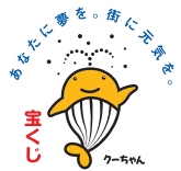
あなたに夢を。届に元気を。 宝くじ

会が、宝くじの助成金で一般コミュニティ助成事業として、新田公民館に拡大印刷機およびプロジェクター、スクリーンなどを整備しました。