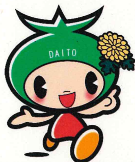
大東市マスコットキャラクター 「ダイトン」

ふるさと納税をされる際にワンストップ特例の申請をされると、寄附された市区町村・都道府県（以下、「市町村等」といいます。）からお住まいの市区町村（寄附先とお住まいが同一市町村の場合を含みます）にふるさと納税額をお知らせし、翌年度の住民税で「申告特例控除額」（所得税・住民税の寄附金控除・寄附金税額控除相当額）が適用されます。