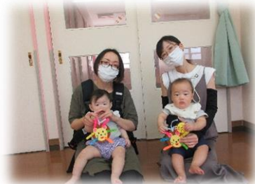
洗濯ばさみのおもちゃ作り