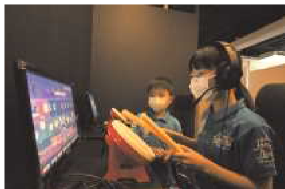
eスポーツスポット大東の様子(eスポーツ体験会)