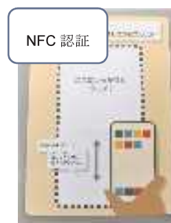
NFCタグにスマホをかざす