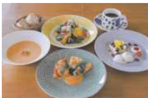
△大東市内のレストラン「Keitto Ruokala」