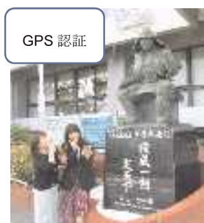
△大東市役所前の三好長慶像