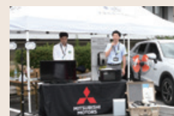
◀ドローンや家電の展示が行われました