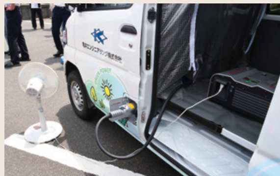
▲電動車両の電源で扇風機が起動