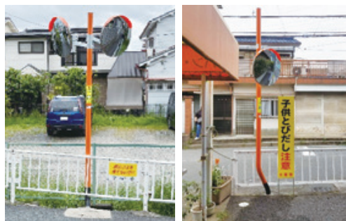
カーブミラーの新設

皆さんから寄せられた通学路危険箇所の情報は、現地調査の上、警察署や道路管理者などと協議を行い、改善に向けた対応を進めています。