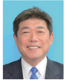
大東市長 東坂 浩一