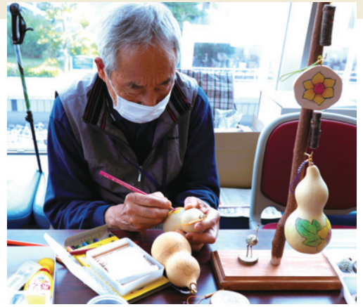
▲かわいいひょうたんづくり

フラダンスや日本舞踊、楽器演奏などの舞台発表のほか、手芸や写真などの作品展示が行われました。開催を喜ぶ参加者たちの気持ちが演技や作品に表れているようでした。