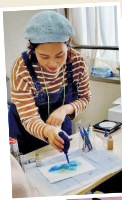
◀集中して絵を描く出展者