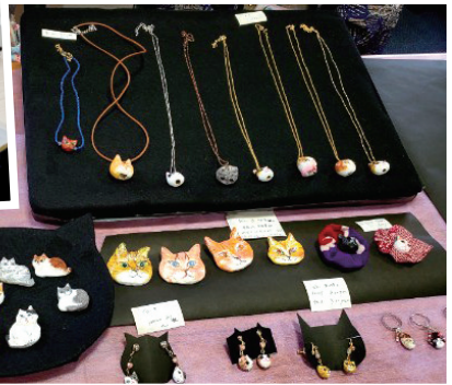
▲すてきな猫のアクセサリ