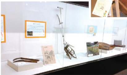
▲さまざまな道具が展示