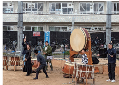
北条ふれ愛フェスティバル