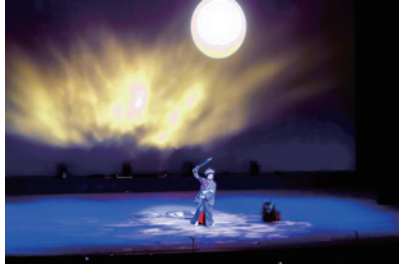
▲幻想的な舞踊に目を奪われました