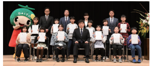
▲1分間スピーチの部発表者