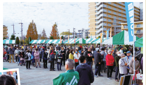
▲大行列の即売コーナー