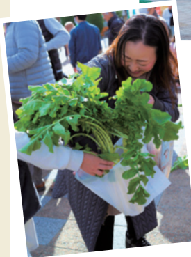
▲袋に収まらないほど 大きな大根