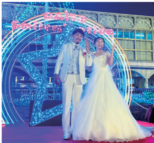
▲会場が幸せに包まれました

ピンクゴールドに輝く「光の回廊」や踏むと音が鳴るピアノ型イルミネーションなど、JR住道駅前デッキが幻想的な空間に大変身。スマイルウェディングでは、新郎新婦の門出を会場全体で祝福し、笑顔と幸せで包まれました。