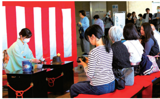
▼茶道体験に大行列