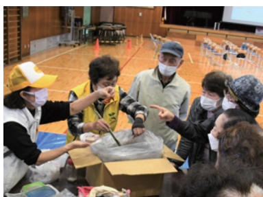
▲さまざまな地区の人が協力しながら体験