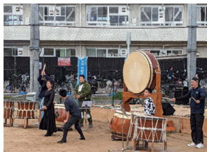
北条ふれ愛フェスティバル