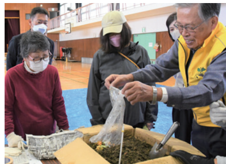
▲土の中の微生物の力で残飯を肥料にします