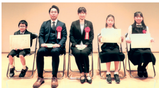
市長賞受賞者の皆さん