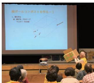
▲まずは作り方の紹介