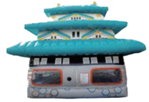
お城のふわふわ遊具もあるよ

午前11時55分ごろ 北条公園を出発 午後0時30分ごろ 野崎まいり公園を出発 午後0時35分ごろ 野崎参道商店街に入る ※時間は変更の場合あり