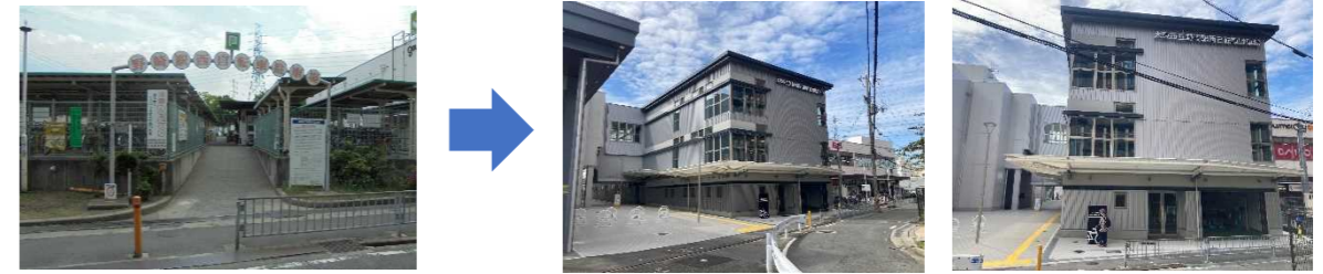
野崎駅自由通路の整備（駅舎の橋上化・駅東西をつなぐ自由通路の設置）